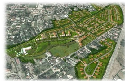
ZAC VAL PARC, Belleville & Saint Jean d'Ardières (69) suivi par IFC ETUDES : 39ha pour 450 logements

révision du PLU. Ce faisant, la notion de respect de l'économie générale du PLU est renforcée.